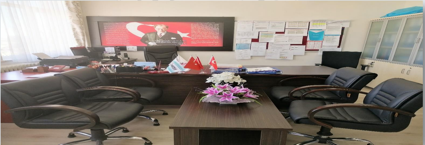
Müdür Yardımcısı Odası